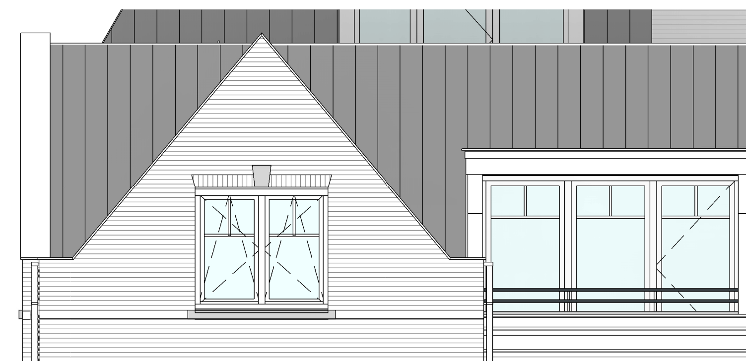
Voorgevel bouwnummer 61